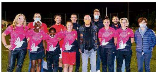
Pour l'événement « Octobre rose », la déléguée en charge des Droits des femmes était présente auprès de l'ASMFF.