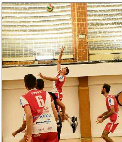
Les volleyeurs monégasques totalement dépassés sur le parquet d'Halluin.

tions à gogo, et mauvais timing au niveau des passes, difficile d'espérer mieux à ce niveau si exigeant de l'Élite.